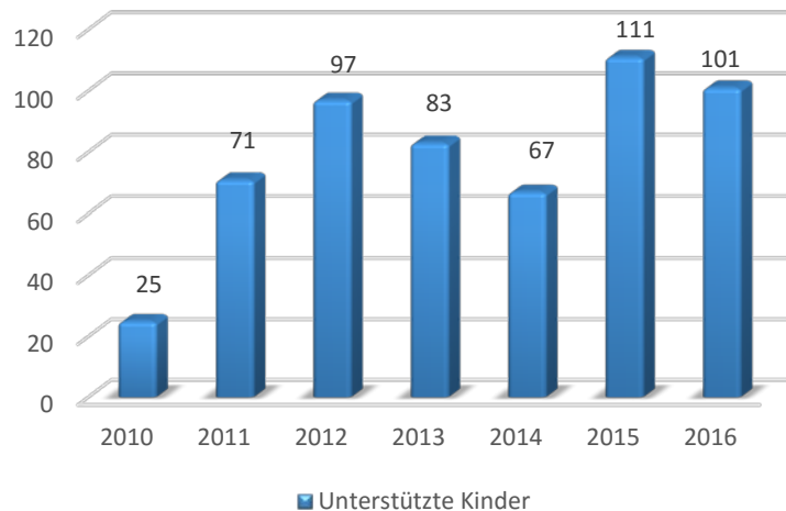
Durch Drittmittel unterstützte Kinder (im Vergleich mit Vorjahren)